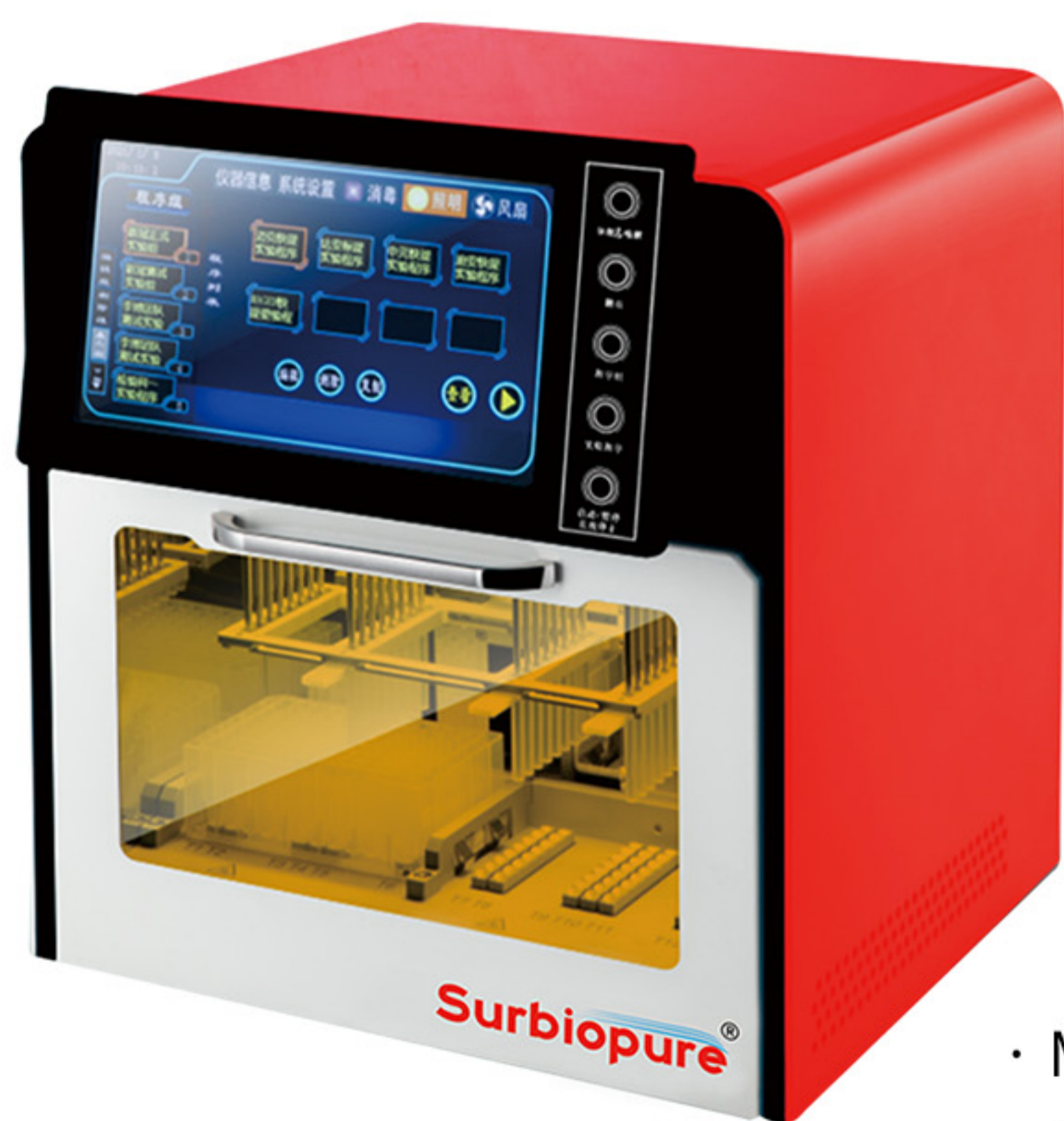
· MyPure-32pro 全自动核酸提取仪

将培养的肠道病毒EV71型（RNA病毒）10倍梯度稀释得到高、中、低三个梯度，使用杭州奥盛核酸提取仪配套Surbiopure®Viral DNA/RNA kit 重复提取20次，使用中山大学达安基因股份有限公司“肠道病毒EV71型核酸测试剂盒（PCR-荧光法）”对得到的结果重复检测。